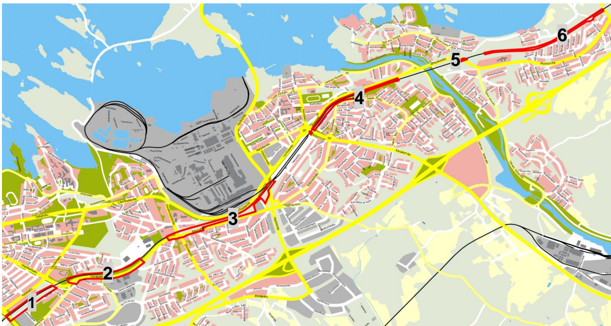
Kuva 1. Kaavamuutosalueet sijoittuvat Lappeenrannan asemalta Laihianrantaan ulottuvalle rataosuudelle. Kaavamuutosalue muodostuu kuudesta osasta, jotka on osoitettu punaisella rajauksella ja numeroin opaskartalla.

Asemakaava ja asemakaavamuutos koskee Lappeenrannan keskustaajamassa olevaa rautatiealuetta sekä tarvittavin osin sen läheisyydessä olevia alueita. Asemakaavan muutosalue jakautuu alustavasti kuuteen osa-alueeseen Harapaisen, Tirilän, Hakalin, Mälkiän ja Laihian kaupunginosiin. Läntisin osa-alue, jolle laaditaan ensimmäinen asemakaava, sijoittuu Vanhan Viipurintien ja Hietalankadun väliselle rataosuudelle (osa-alue 1). Asemakaavamuutosten osa-alueet 2–6 sijoittuvat Hietalankadun alikulun ja Kiiskinmäen alikulun väliselle alueelle. Myös Pontuksen asuinalueelle rata-alueelle laaditaan ensimmäinen asemakaava (osa-alue 6). Kaavamuutosalueiden sijainnit ja likimääräiset rajaukset näkyvät oheisessa kartassa (kuva 1). Alueiden rajaukset tarkentuvat suunnittelun edetessä.