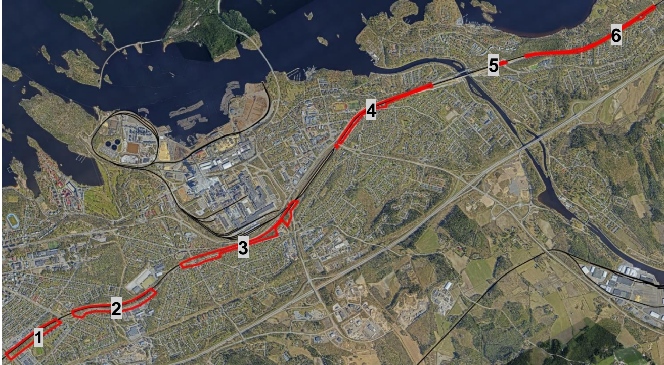
Kuva 2. Ortoilmakuva alueelta (ortoilmakuvayhdistelmä vuosilta 2020–2018). Kaavamuutosalueen osa-alueet on merkitty punaisella rajauksella ja numeroin kuvaan.

Asemakaavamuutoksen tavoitteena on mahdollistaa kaksoisraiteen rakentaminen Lappeenrannan keskustaajaman rata-alueille Lappeenranta–Muukko-kaksoisraiteen ratasuunnitelman mukaisesti. Uusi raide rakennetaan nykyisen raiteen eteläpuolelle, jonka takia nykyistä rautatiealuetta on levennettävä monin paikoin. Kaavasuunnittelussa huomioidaan mm. melun- ja tärinätorjunta sekä luonnonympäristöön liittyvät tekijät. Lisäksi tutkitaan mahdollisia maa-ainesten sijoituspaikkoja. Asemakaavaa laaditaan rinnan Lappeenranta–Muukko-kaksoisraiteen ratasuunnitelman kanssa.