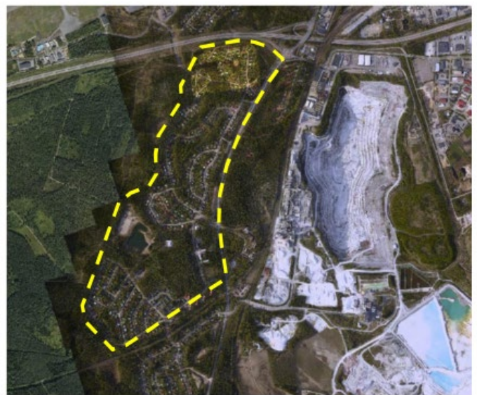
Ortoilmakuvayhdistelmä v. 2015 – 2017.

Suunnittelun tavoitteena on alueen asemakaavan päivittäminen, lisärakennusmahdollisuuksien tutkiminen ja alueen rakentamistavan ohjaaminen vanhan miljööseen luonne säilyttäen. Alueella voimassa olevista asemakaavoista suurin osa on todettu vanhentuneiksi, siihen nähden millaista rakentamista alueelle tulevaisuudessa halutaan ja miten alueen rakennettua kulttuuriympäristöä halutaan säilyttää. Suunnittelun tavoitteena on tiivistää yhdyskuntarakennetta olemassa olevan infrastruktuurin alueella ja samalla säilyttää alueen ominaispiirteet. Lisäksi huomioidaan eri toimintojen laajenemistarpeet.