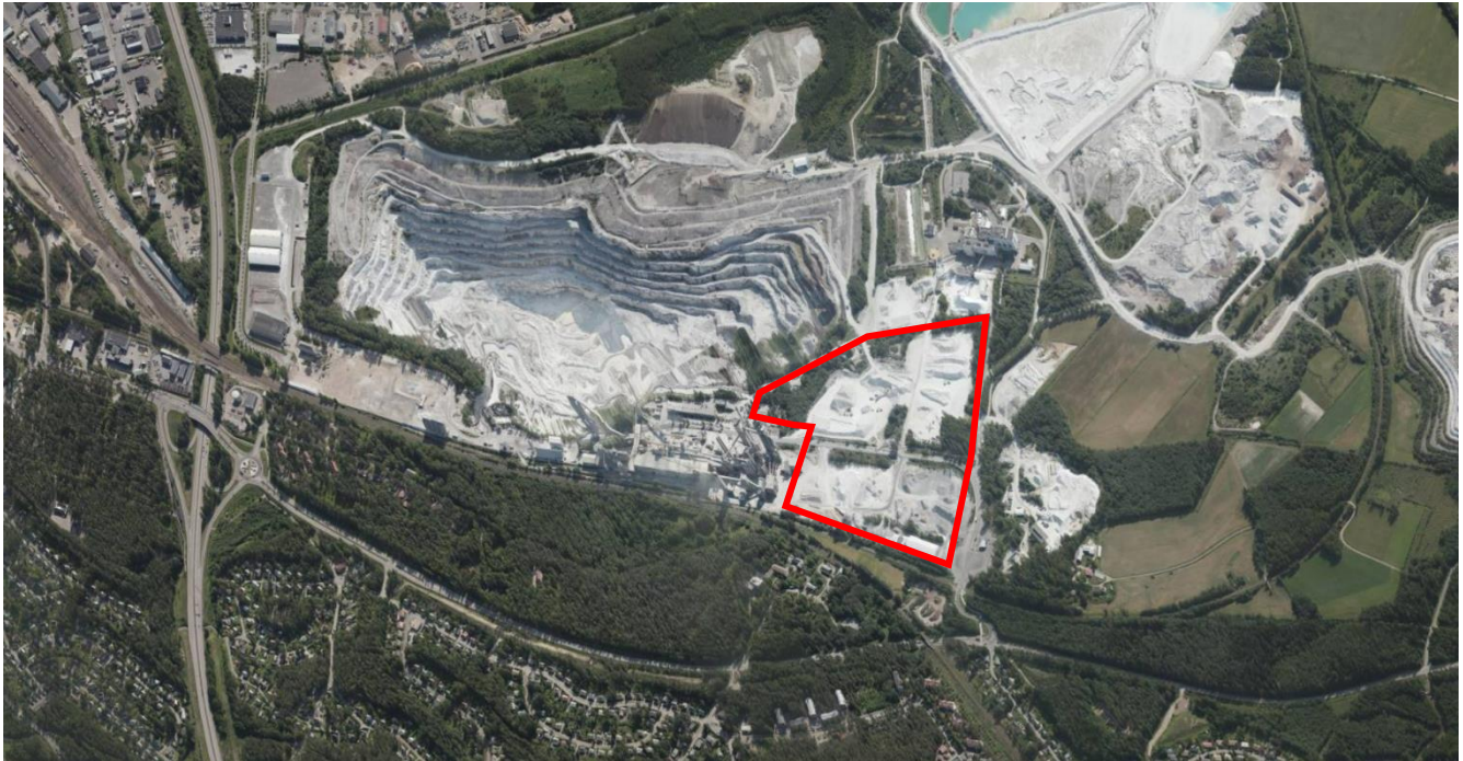
Kuva 2. Ortoilmakuva alueelta vuodelta 2018 © Blom. Kaavamuutosalueen likimääräinen raja on merkitty punaisella viivalla. Karttapohjoinen on kuvassa vasemmalla.

Nordkalk Oy Ab:n aloitteesta kaava-alue on laajennettu OAS kuulemisen aikana ulottumaan lännessä rautatiealueeseen saakka. Laajennuksen tarkoituksena on yhteensovittaa kaivoksen ja metanolilaitoksen maankäyttötarpeet ja kulkuyhteydet.